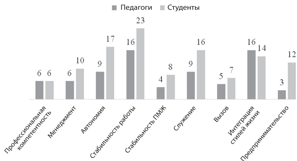
Рис. 2. Система профессиональных/карьерных ценностных ориентаций (количество выборов)

Согласно результатам диагностики (рис. 1), в системе личностных смыслов студентов и педагогов в разных количественных соотношениях доминируют смыслы категорий: самореализации, семейные и экзистенциальные (понимание жизни не как заданной, а как являющейся продуктом выбора). Смыслы когнитивной категории (способность искать и перерабатывать информацию) выбрали меньше других.